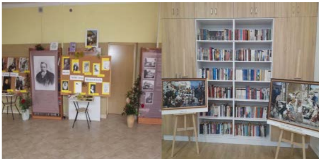
Wystawa w ramach projektu „Henryk Siemiradzki – częścią historii Strzałkowa”, wystawa reprodukcji dzieł Henryka Siemiradzkiego - Gminna Biblioteka Publiczna w Strzałkowie

- Gminna Biblioteka Publiczna w Strzałkowie wraz z Filią w Płoszowie , która jest samorządową instytucją kultury i wchodzi w skład ogólnopolskiej sieci bibliotecznej. Biblioteka pełni bardzo ważną funkcję w prowadzeniu działalności kulturalnej i oświatowej organizując spotkania, warsztaty i wystawy poświęcone historii gminy, jej kulturze, znanym mieszkańcom, tradycjom i wydarzeniom.