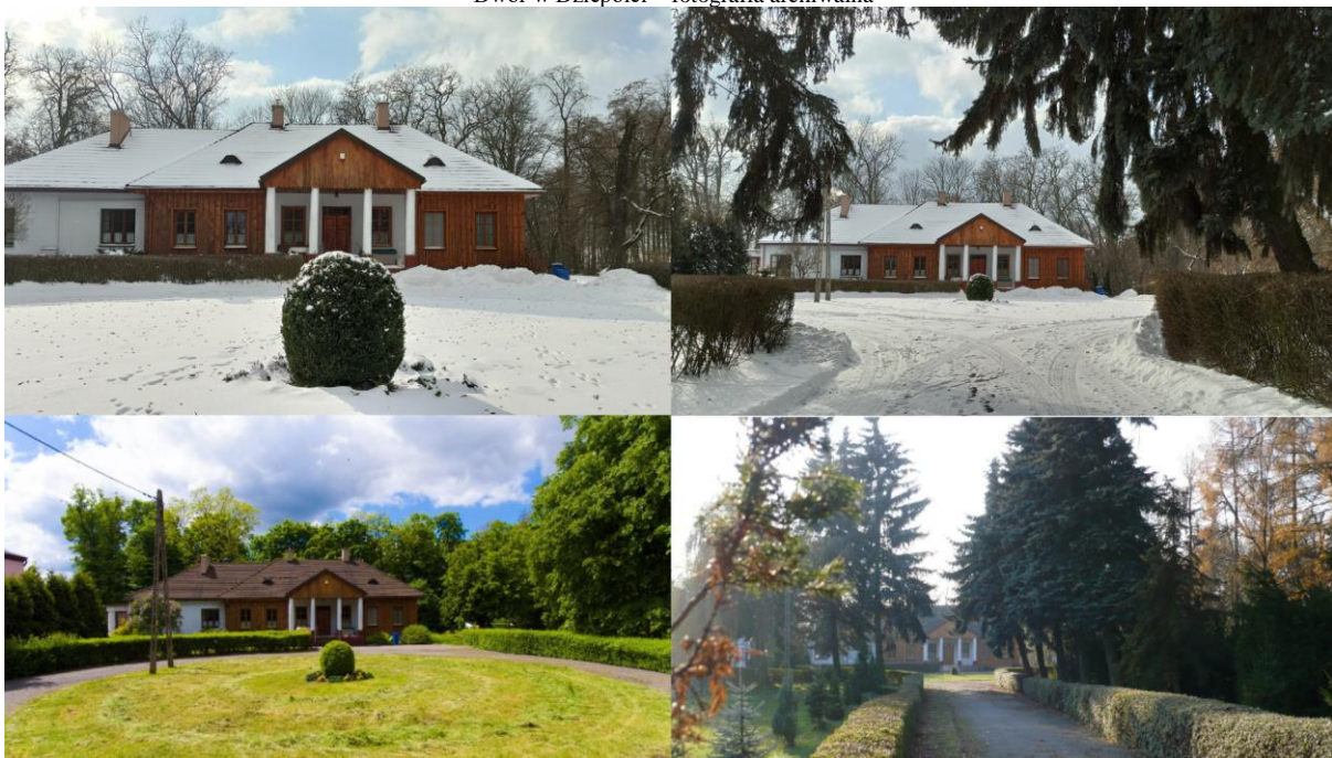
Dwór i park dworski w Dziepóci