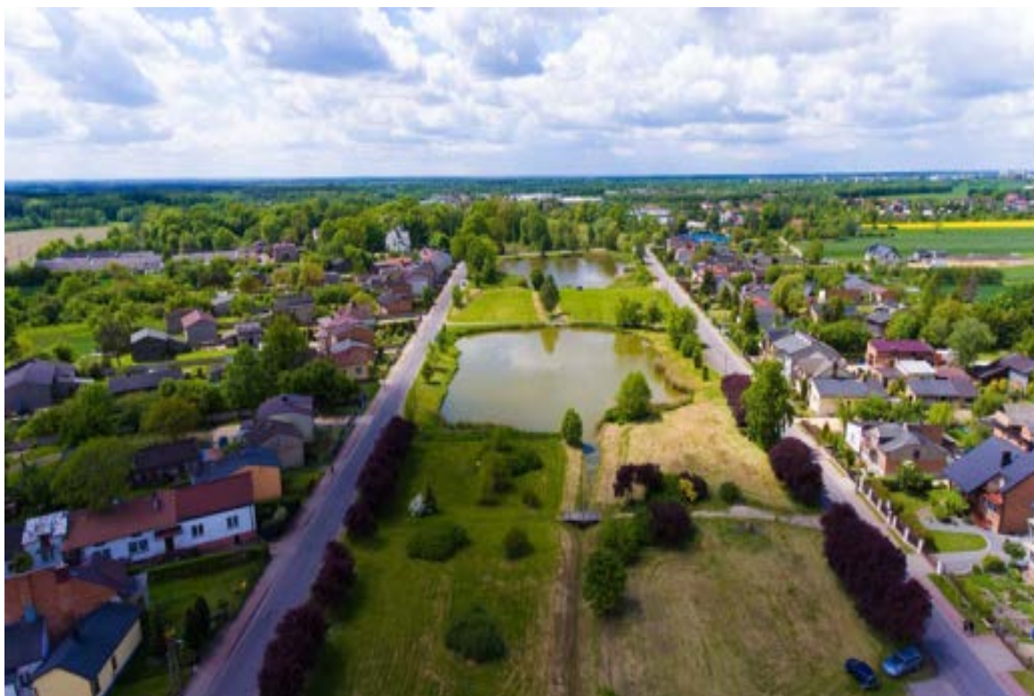
Widok od strony centrum Strzałkowa na zabytkowy kościół parafialny i park pałacowy, granice poprzedniego układu przestrzennego