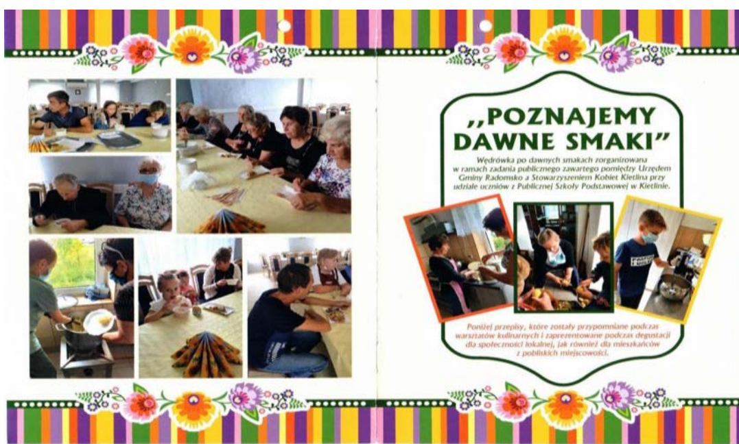
Folder wydany podczas warsztatów kulinarnych zorganizowanych przez Stowarzyszenie Kobiet Kietlina

Najbardziej aktywnie działające organizacje pozarządowe to: Stowarzyszenie Kobiet Kietlina w Kietlinie, Koło Gospodyń Wiejskich w Strzałkowie, Koło Gospodyń Wiejskich w Dziepółci, Zespół Ludowy „Dziepółlanki” w Dziepółci, Stowarzyszenie „Aktywni dla Płoszowa” w Płoszowie, Koło Gospodyń Wiejskich „Szczepocice Rządowe nad Wartą” w Szczepolicach oraz Koło Gospodyń Wiejskich „Makowe Paniarki” w Kietlinie.