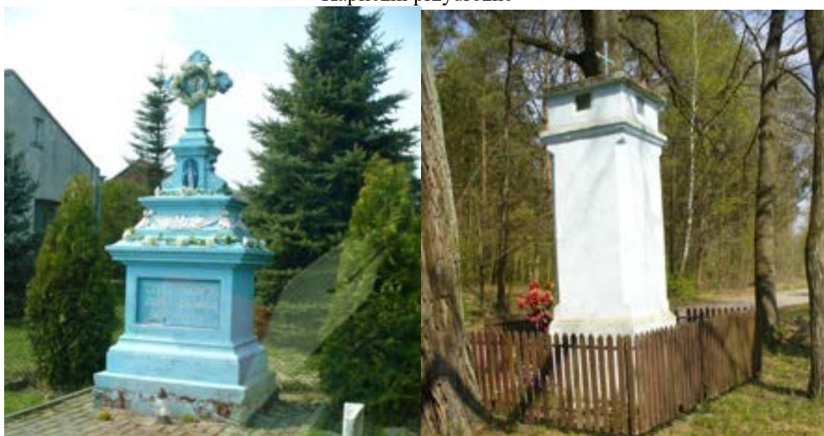
Od lewej: kapliczka przydrożna w m. Dziepół przy drodze gminnej w kierunku Orzechówka, kapliczka w m. Cerkawizna