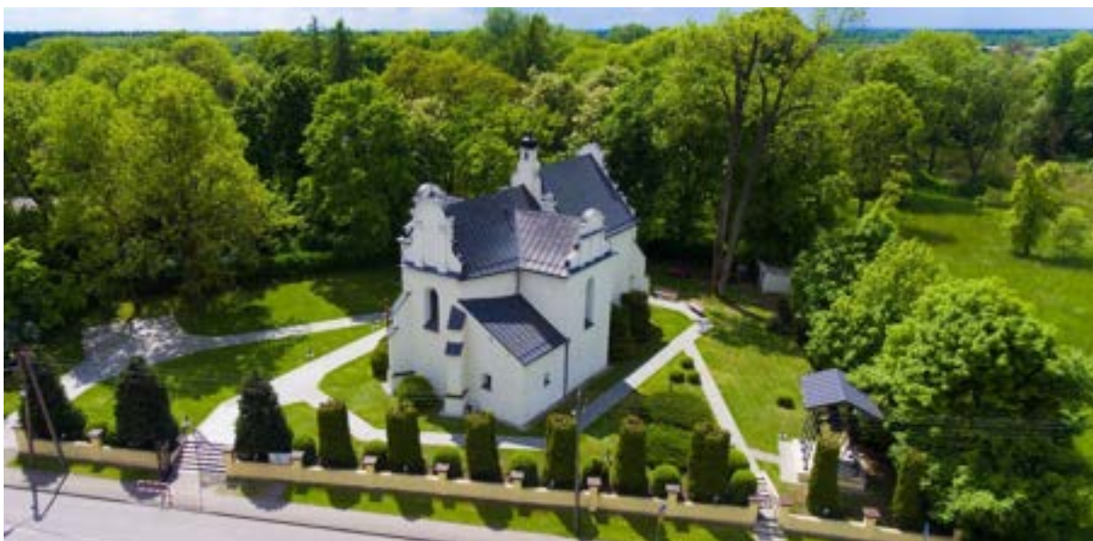
Kościół rzymsko - katolicki p.w. Nawiedzenia NMP w Strzałkowie – od lewej u góry fotografie archiwalne, fotografie aktualne