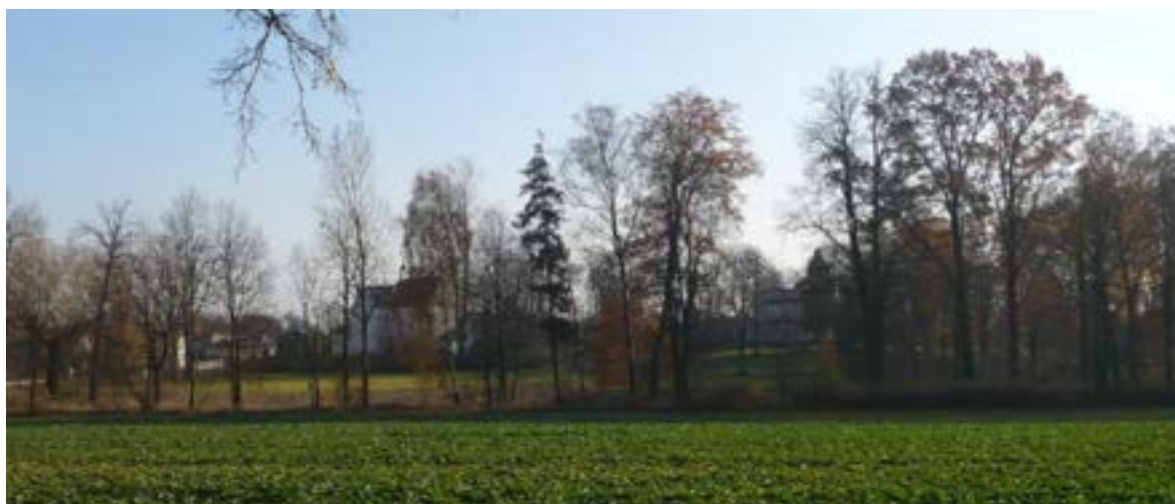
Widok na kościół parafialny, zabytkowy park pałacowy, dwór od strony ul. Kochanowskiego, obszar ochrony konserwatorskiej układu przestrzennego