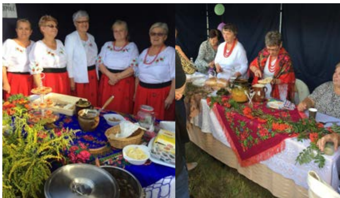
Prezentacja działalności KGW w Dziepółci (od lewej) i KGW w Strzałkowie podczas pikniku rodzinnego w Strzałkowie

Gmina Radomsko wspiera działalność organizacji pozarządowych, m.in. udostępniając nieodpłatnie lokale, wyposażenie oraz współpracuje w realizacji zadań publicznych m.in. w zakresie kultury i ochrony dziedzictwa narodowego. Stowarzyszenia mają swoje siedziby w: Kietlinie – Stowarzyszenie Kobiet Kietlina i Koło Gospodyń Wiejskich „Makowe Panienki”, Płoszowie – „Stowarzyszenie Aktywni dla Płoszowa”, Strzałkowie – Koło Gospodyń Wiejskich i Szczepocicach Rządowych – Koło Gospodyń Wiejskich „Szczepocice Rządowe nad Wartą”. W tych miejscach odbywają się cykliczne spotkania członków stowarzyszeń, imprezy kulturalne, warsztaty oraz prowadzone są inne formy aktywności kulturalnej.