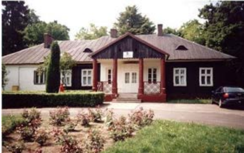
Dwór w Dziepóci – fotografia archiwalna