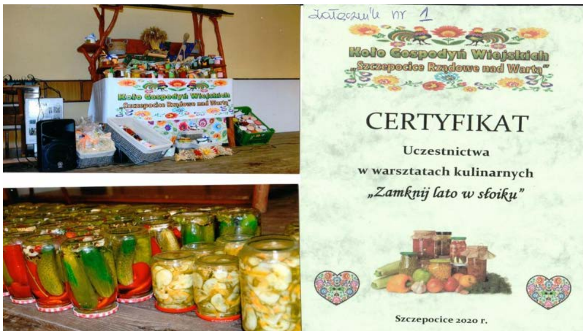
Warsztaty kulinarne zorganizowane przez Koło Gospodyń Wiejskich „Szczepocice Rządowe nad Wartą”