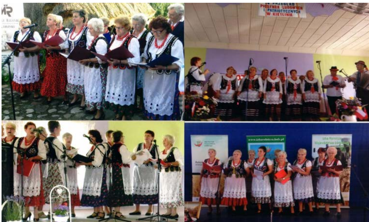
Występy zespołu wokalnego „od A do Z” działającego przy Stowarzyszeniu Kobiet Kieźlina