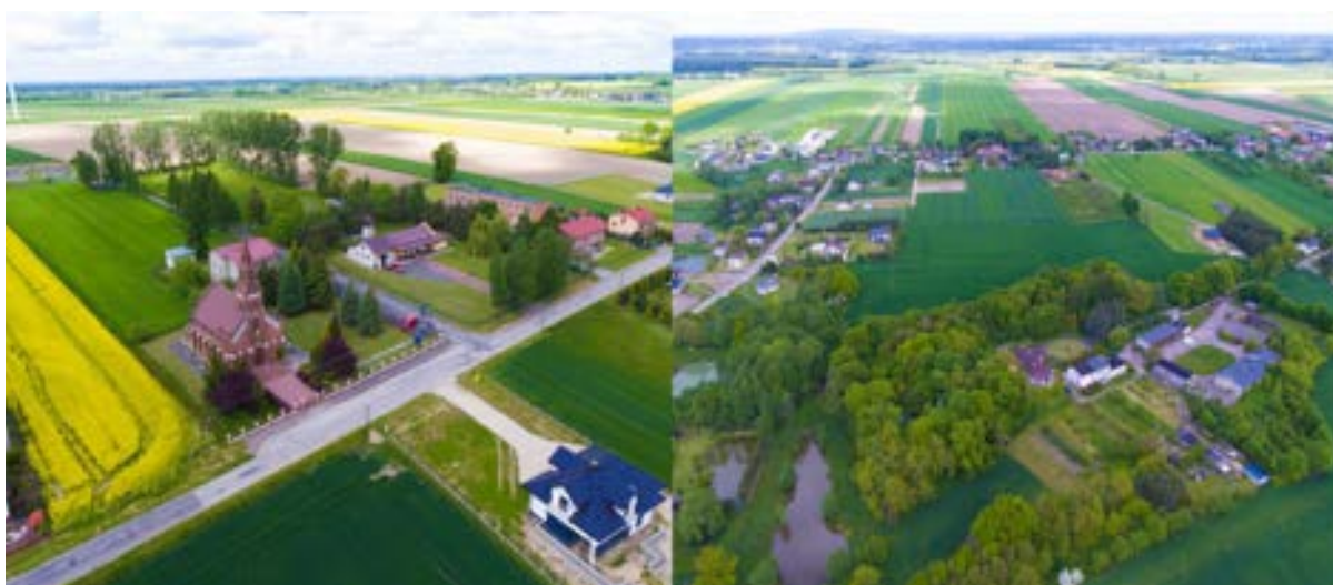
Widok na zabytkowy kościół oraz park i dwór w Dziepólni