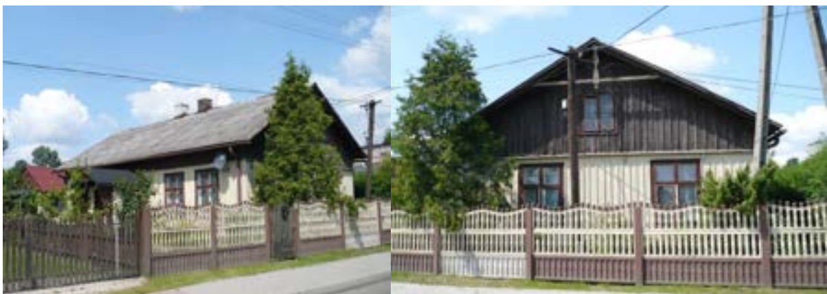
Chalupa drewniana w miejscowości Płoszów

Na uwagę zasługuje zachowany w dobrym stanie i do niedawna zamieszkały dom drewniany w Płoszowie. Jego powstanie datowane jest na rok 1910. Obiekt wpisany został w 2016 r. do Gminnej Ewidencji Zabytków, zlokalizowany jest w centrum wsi, przy głównej drodze, stanowi ciekawy przykład architektury drewnianej na terenach wiejskich.