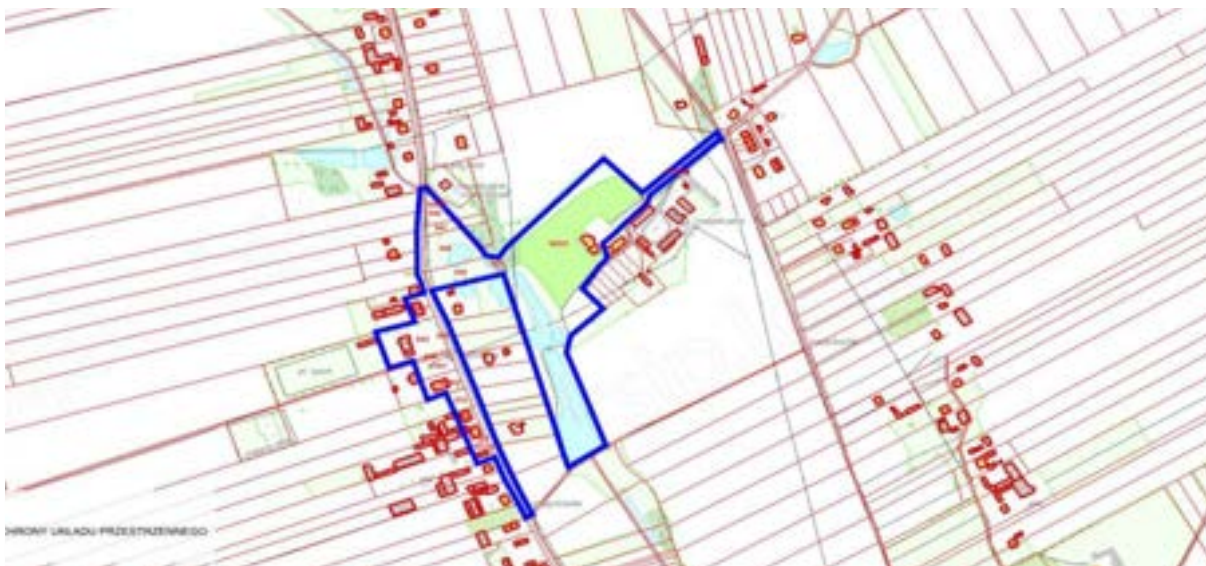
Aktualne granice obszaru ochrony konserwatorskiej układu przestrzennego