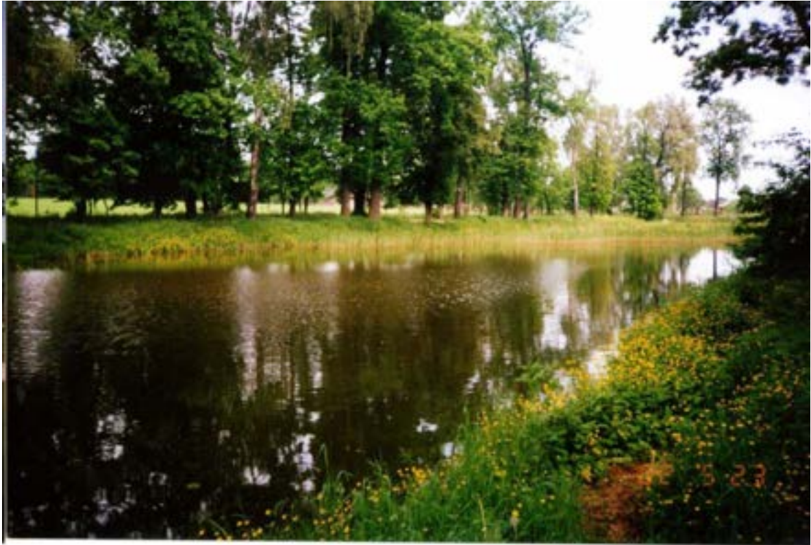
Fragment parku pałacowego – fotografia archiwalna