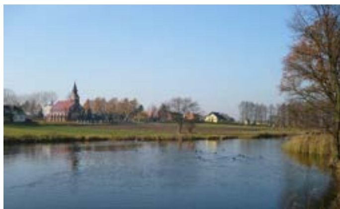
Widok na zabytkowy kościół i część parku dworskiego w Dziepólni, fragment obszaru granic ochrony konserwatorskiej układu przestrzennego