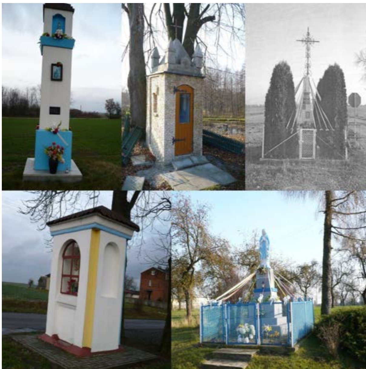
Od lewej u góry: kapliczka w m. Kietlin przy drodze wojewódzkiej w kierunku Końskich (1882), kapliczka w m. Grzebień w centrum wsi (1939 r.), kapliczka w m. Okrajszów przy skrzyżowaniu dróg – gminnej i miejskiej (1932 r.), kapliczka w m. Dziepółc przy skrzyżowaniu dróg powiatowej i gminnej w kierunku Orzechówka

Na terenie Gminy Radomsko ochroną polegającą na umieszczeniu kapliczek w Gminnej Ewidencji Zabytków w 2016 roku objęto 5 obiektów, najstarsza z nich datowana jest na rok 1882 r. Poniżej ich fotografie.