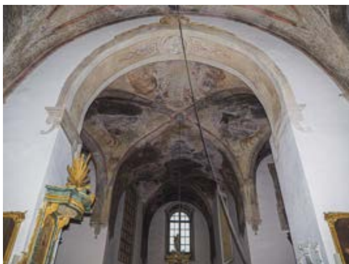
Zagrożona polichromia w kościele rzymsko – katolickim p.w. Nawiedzenia NMP w Strzałkowie