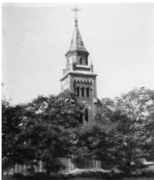
Fotografia archiwalna kościoła ewangelickiego w Dziepólci.