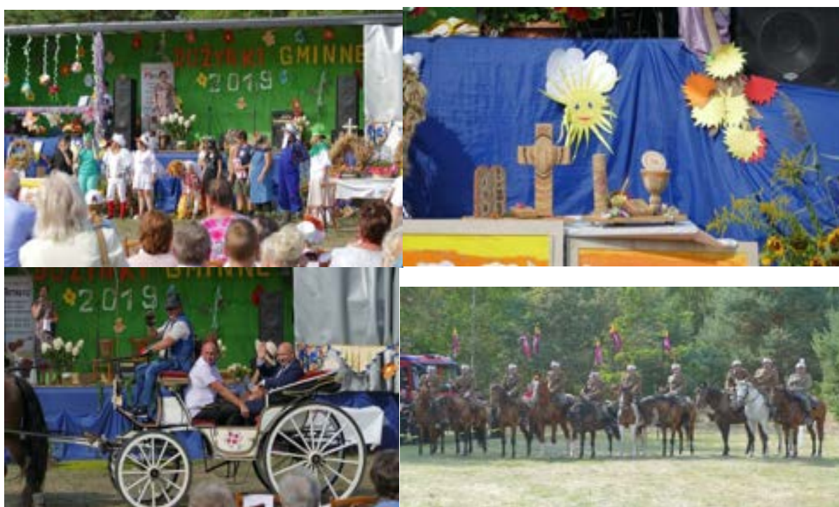
Dożynki gminne w Płoszowie zorganizowane przez Stowarzyszenie „Aktywni dla Płoszowa”.