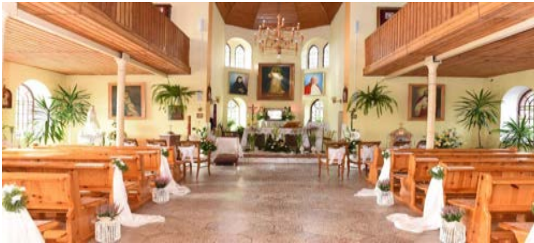
Wnętrze kościoła parafialnego w Dziepólci