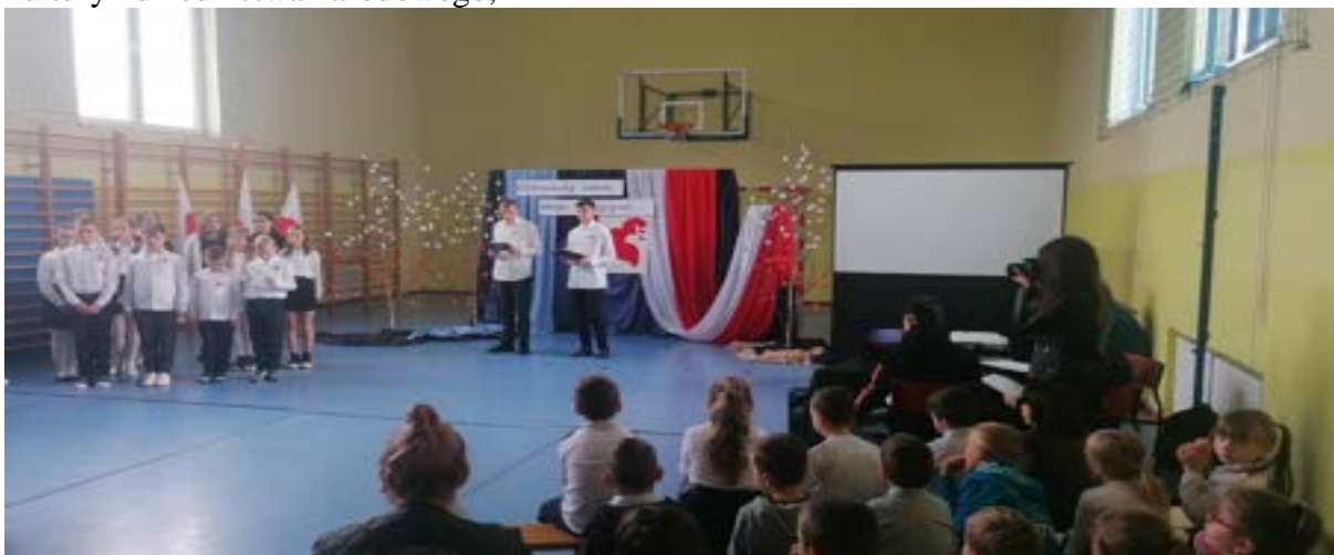
Obchody Narodowego Święta Niepodległości w Publicznej Szkole Podstawowej w Szczepolicach.

- pięć publicznych szkół podstawowych w: Dziepółci, Kietlinie, Płoszowie, Strzałkowie i Szczepolicach, które oprócz tego, że zapewniają dzieciom i młodzieży jak najlepsze warunki do pobierania nauki, są również miejscem poznawania, pielęgnowania i kultywowania tradycji, kultury i dziedzictwa narodowego,