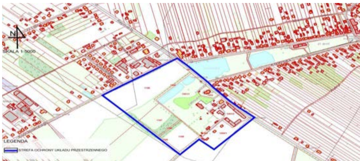
Aktualne granice ochrony konserwatorskiej układu przestrzennego