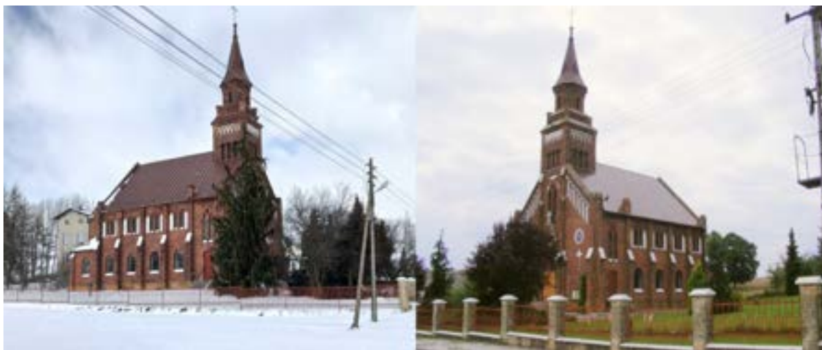
Kościół rzymskokatolicki p.w. Miłosierdzia Bożego w Dziepólci (poewangelicki)

W 2014 roku kościół wraz z otoczeniem uzyskał pełną ochronę konserwatorską. Dzięki wsparciu finansowemu Gminy Radomsko i Urzędu Marszałkowskiego w Łodzi, w ostatnich latach udało się: wyremontować wieżę dzwonnicy kościoła (2015 r.), wieżyczki oraz attykę (2016 r.), pokryć nową powłoką malarską pokrycie dachowe i wymienić orywnowanie oraz ujednolicić kolorystykę fragmentów elewacji kościoła (2017 r.), w 2021 roku wymienić drzwi wejściowe do kościoła (środkie parafii) oraz drzwi boczne (wsparcie finansowe Gminy Radomsko). Obecnie trwa wymiana okien dzięki wsparciu Urzędu Marszałkowskiego w Łodzi.