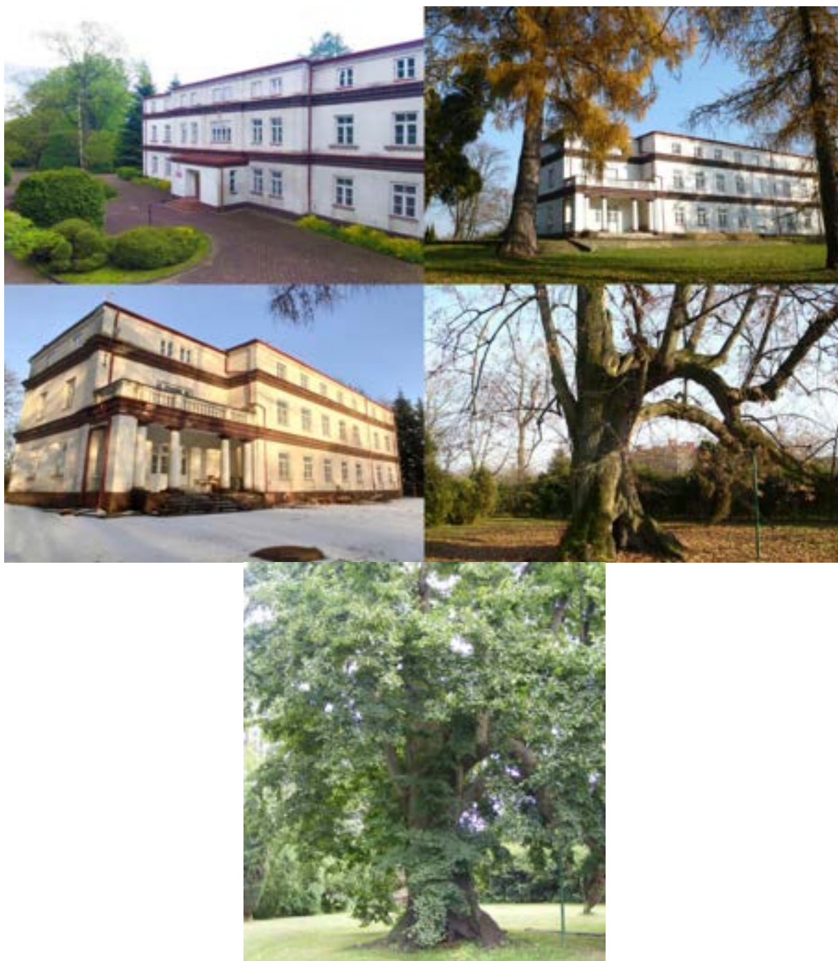
Od góry: pałac i park pałacowy w Strzałkowie, Lipa Siemiradzkieg

W wyniku reformy rolnej przeprowadzonej na mocy dekretu PKWN z dnia 6 września 1944 r. majątek z całymi Dobrami Ziemijskimi Strzałków przejęty został na własność Skarbu Państwa i przekazany we władanie Zasadniczej Szkoły Rolniczej i Technikum Rolniczemu. Po raz kolejny został przebudowany w związku z użytkowaniem go na cele oświatowe. Po reformie administracyjnej i utworzeniu powiatów w 1999 r. nieruchomość stała się własnością Powiatu Radomszczańskiego i była dalej użytkowana na cele oświatowe. Funkcjonujący tam Zespół Szkół Agrobiznesu w Strzałkowie został zlikwidowany; w 2011 r. spadkobiercy byłych właścicieli wystąpili o zwrot części nieruchomości obejmującej pałac wraz z zabytkowym parkiem pałacowym. Nieruchomość o pow. 4,04 ha została przekazana spadkobiercom byłych właścicieli w ostatnich dniach 2020 r. Pozostała część nieruchomości (grunty rolne, pastwiska, zabudowania gospodarcze) o pow. 57,45 ha stała się własnością Powiatu Radomszczańskiego.