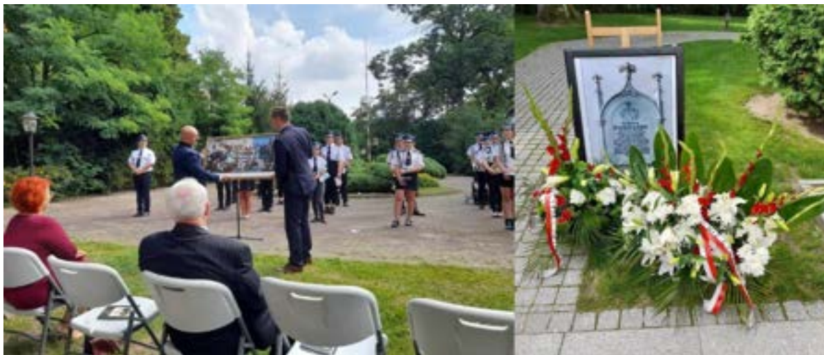
Realizacja projektu pt. „Henryk Siemiradzki – częścią historii Strzałkowa” realizowanego przez Ochotniczą Straż Pożarną w Strzałkowie wspólnie z Parafią katolicką pw. Nawiedzenia NMP w Strzałkowie

- parafie katolickie w: Dziepółci, Kietlinie, Płoszowie, Strzałkowie i Szczepocicach, które bardzo aktywnie włączają się w życie kulturalne i społeczne mieszkańców organizując dożynki parafialne, wieczornice, uroczystości patriotyczne oraz aktywnie działają na rzecz ochrony obiektów zabytkowych i stanu zachowania obiektów sakralnych oraz cmentarzy parafialnych.