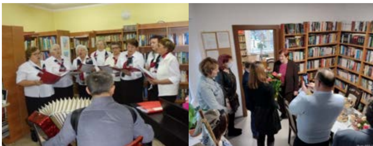
Występy zespołu „Czerwona Kalina” działającego przy Kole Gospodyń Wiejskich w Strzałkowie w GBP w Strzałkowie (od lewej) i otwarciu Filii GBP w Płoszowie po kapitalnym remoncie.